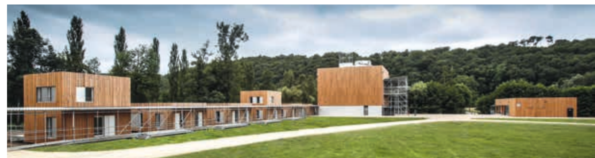
Projet financé par la ville de Boulazac Isle Manoire, la DRAC Nouvelle-Aquitaine, le Ministère de la Culture, la Région Nouvelle-Aquitaine, le Conseil départemental de la Dordogne.

En s'offrant un village pour ses trente ans, l'Agora s'est choisi un cadeau auquel ses amis ne pouvaient refuser de participer. Le Ministère de la Culture et la DRAC sont donc heureux de fêter cet anniversaire, qui n'est pas seulement la consécration d'une histoire pleine de succès, mais le commencement d'une nouvelle aventure pleine de promesses.